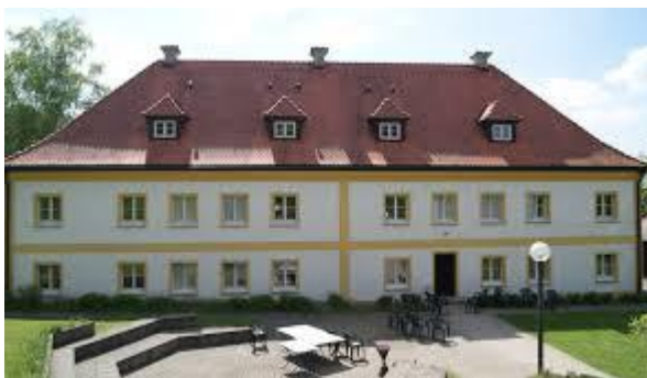
Tagungshaus beim Kloster